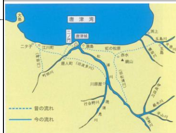
松浦川・波多川・神田川 —昔の流れと今の流れ—