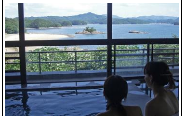
雄大な海を一望できる 解放感あふれる温泉