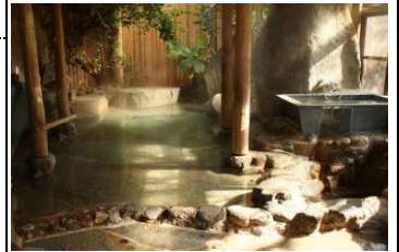
緑深い山里にも温泉が湧出しています。 （『唐津探訪』より）