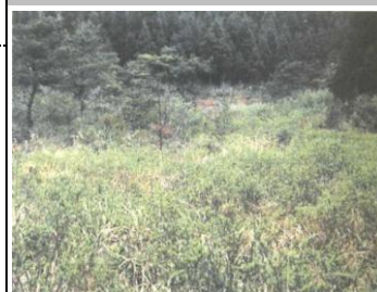
奥平湿原動植物群 （『巖木町史』より）