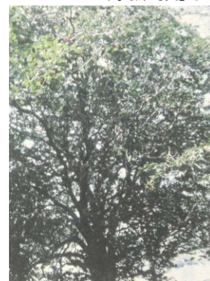
観音堂のヤブツバキ（ツバキ科）二株 （『巖木町史』より）