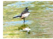
※写真5：セグロセキレイ